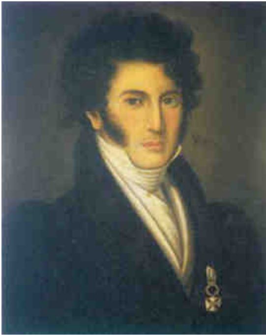
Juan Álvarez de Mendizábal