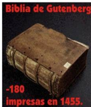
-180 impresas en 1455.

La mayoría fue impresa en papel; unas pocas en pergamino.