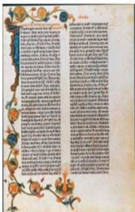
Página de la Biblia de Gutenberg, adornada a mano.

Prensa de impresión de tipo móvil. "La invención más importante del segundo Milenio" (Time). Antes de ella, el costo de un libro copiado a mano equivalía al de una casa en la ciudad o una finca grande. 100,000 piezas de tipo se necesitaban para imprimir la Biblia Gutenberg. Costo de esta en aquel tiempo: 30 florins, el sueldo de tres años de un funcionario.