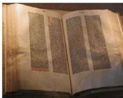
Ejemplar auténtico de la Biblia de Gutenberg (1455). Uno de 48 en el mundo. Biblioteca del Congreso de Estados Unidos.