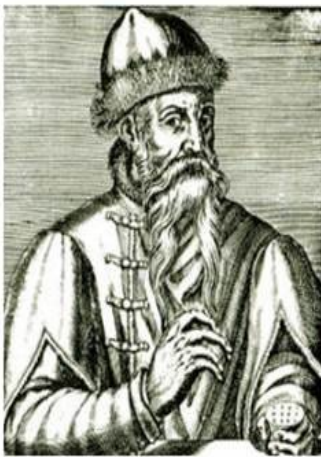
Johannes Gutenberg, inventor de la prensa de tipos móviles. (1398 - 1468)