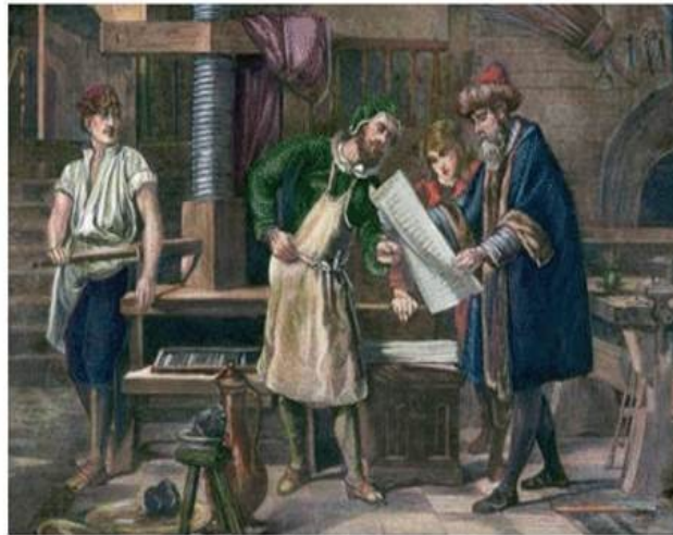
Pintura. Taller de Gutenberg. "¡Primera impresión!" Año 1450.